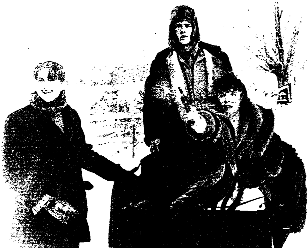
أخوة السلاح بين المرأة والرجل فوق السهول البيضاء